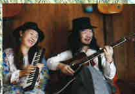
髭と長髪とわたし