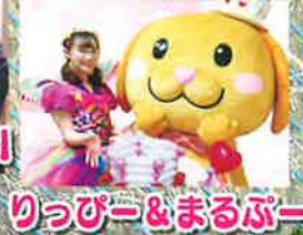
りっぴー&まるぷー